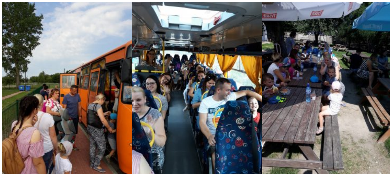
WYCIECZKA Z RODZICAMI